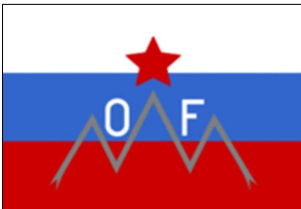
Simbol OF: narodna zastava z zvezdo in Triglavom