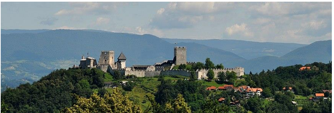
Celjski zgornji grad

1456 umre zadnji Celjan Ulrik II v Beogradu