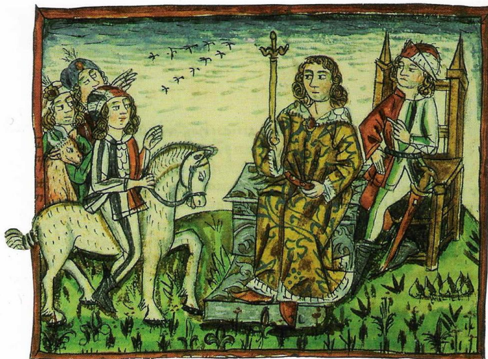
Ustoličevanje na vojvodskem prestolu